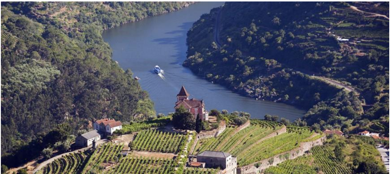
六善度假酒店(Six Senses Douro Valley)