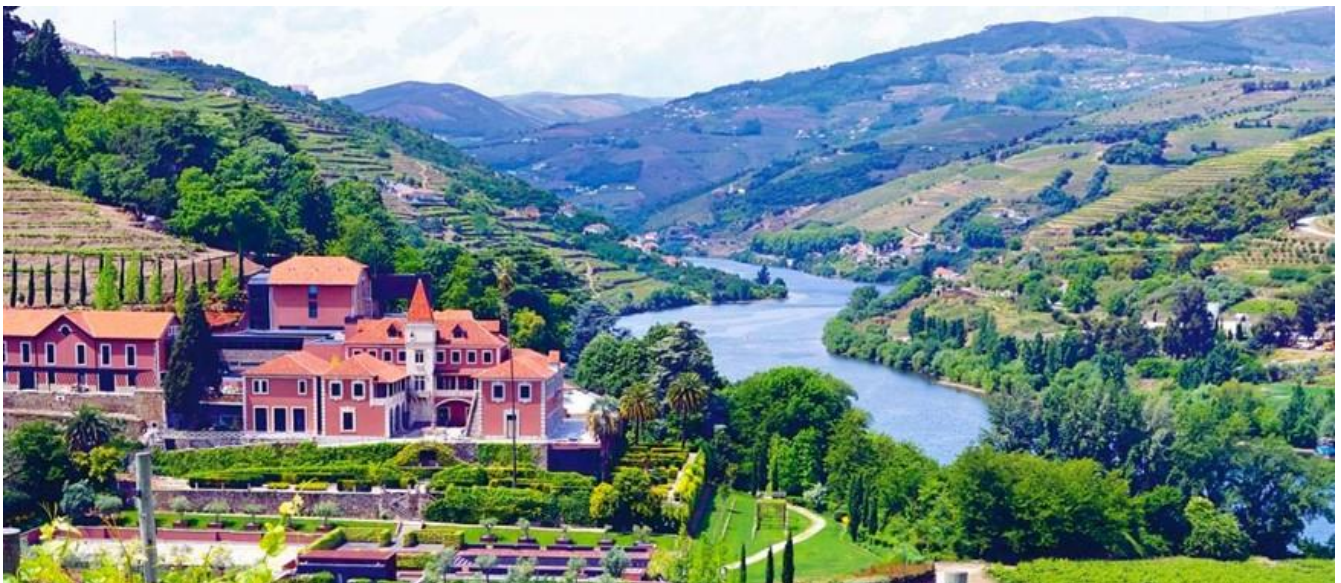
六善度假酒店(Six Senses Douro Valley)