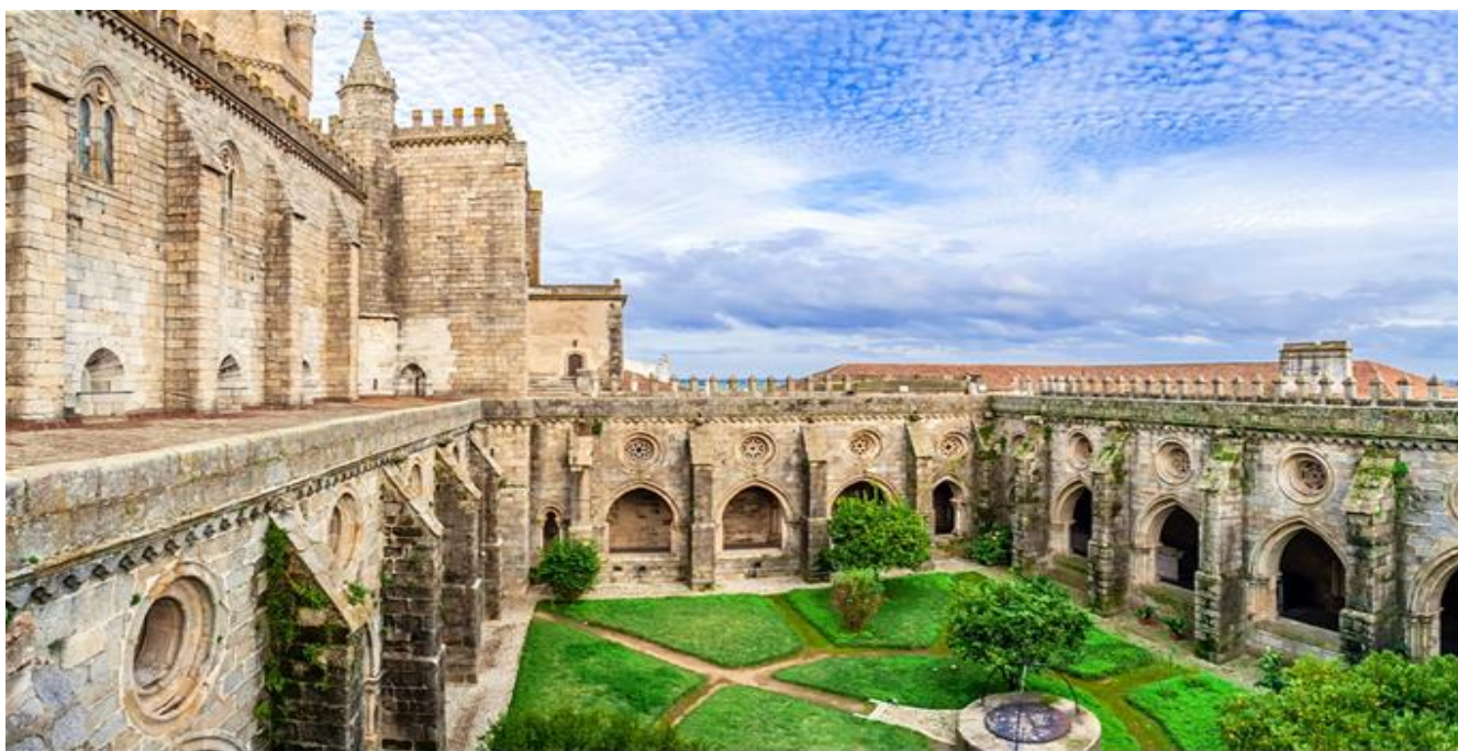
埃武拉主教座堂(Cathedral Sé de Évora)

住宿 | 5★山楂修道院豪華水療酒店 Hotel Convento do Espinheiro