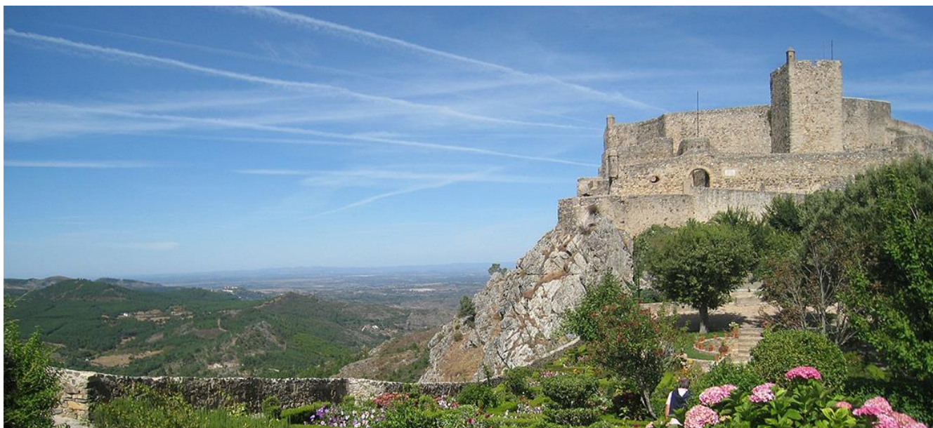
馬爾旺城堡(Castle of Marvão)

住宿 | 5★Convento do Seixo Boutique Hotel & Spa 或同級