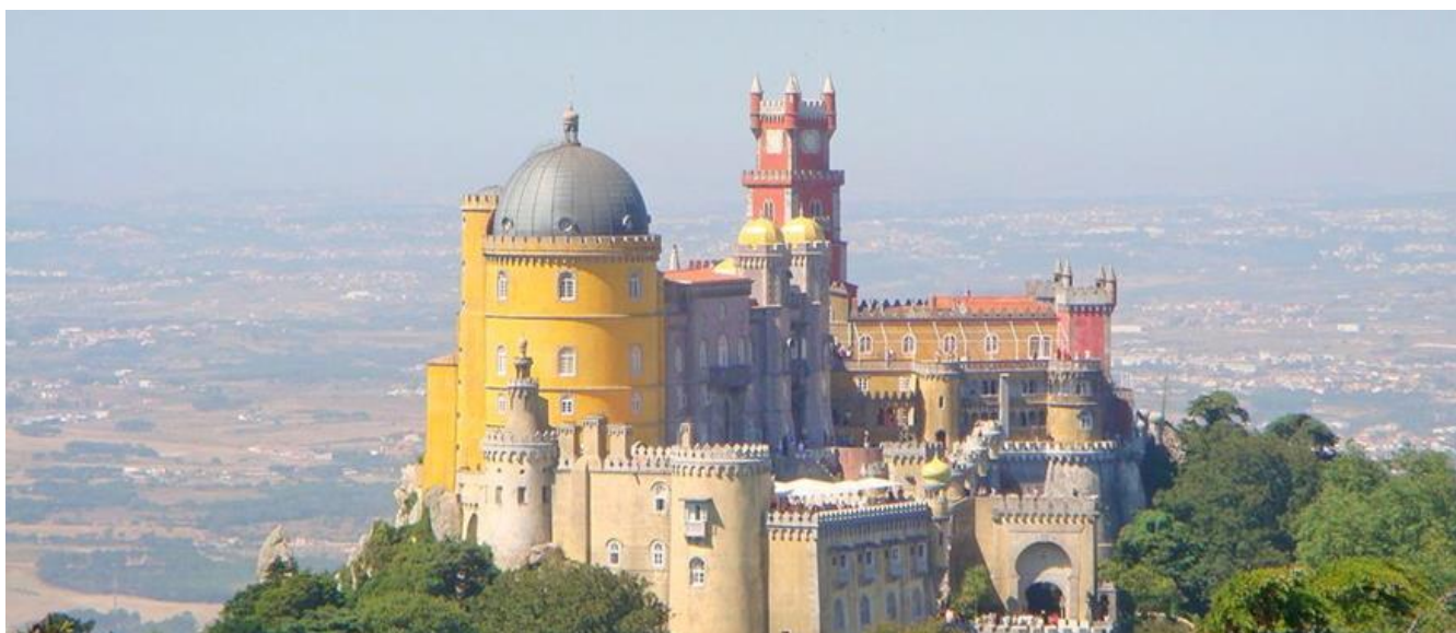
佩納宮(Palácio Nacional da Pena)