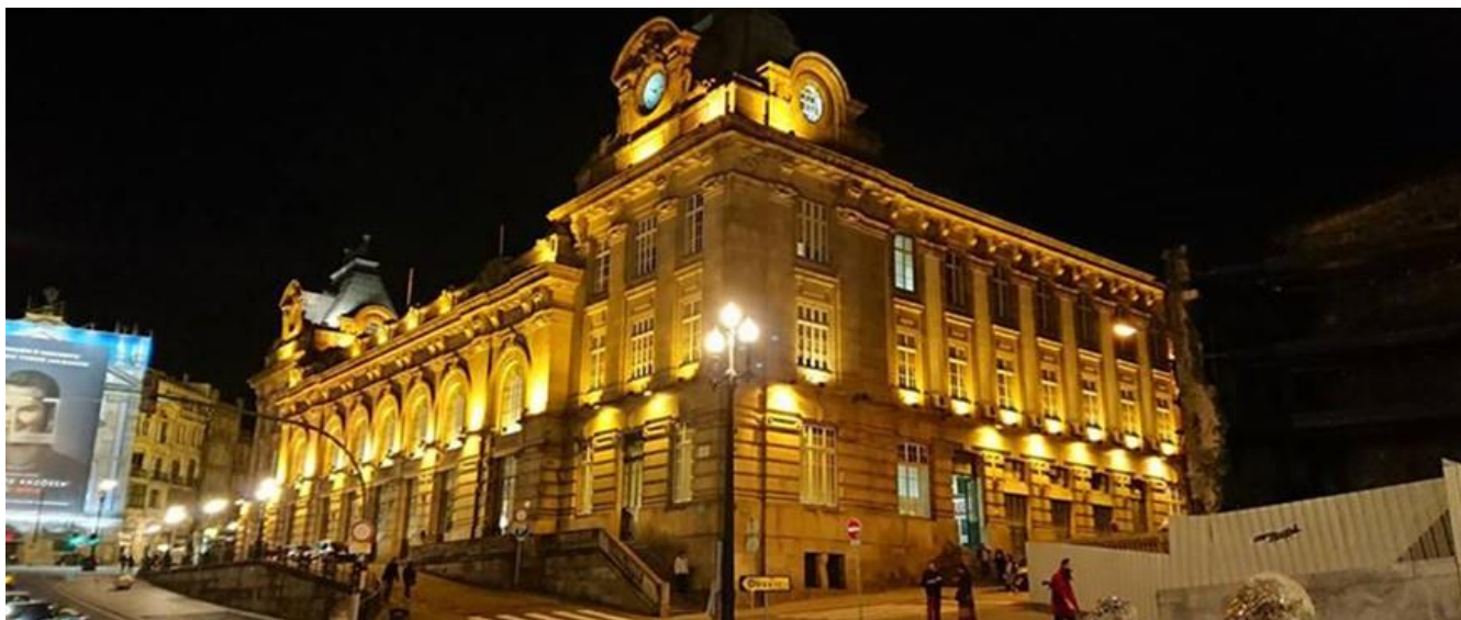
聖本篤車站(São Bento Railway Station)