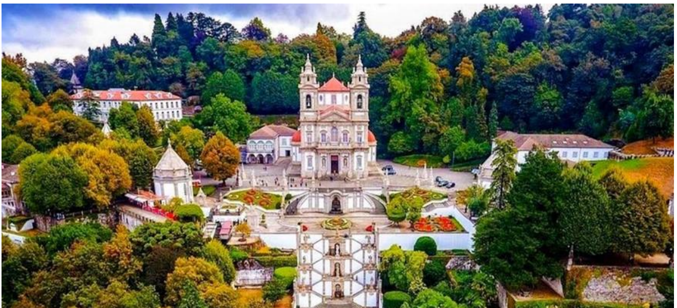
山上仁慈耶穌朝聖所(Bom Jesus do Monte)