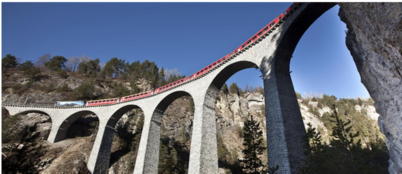
伯連納火車大迴旋