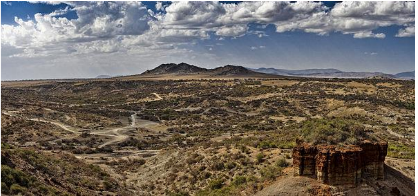
奧杜威峽谷 Olduvai Gorge Museum

住宿 | Serengeti Lodge, Member of Melia Collection 或同級