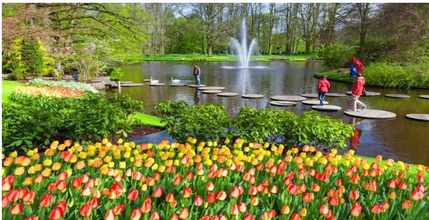
庫肯霍夫鬱金香花園

住宿 | 5★Grand Hotel Amrath Kurhaus The Hague