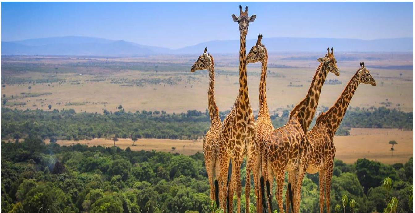
馬賽馬拉野生動物保護區