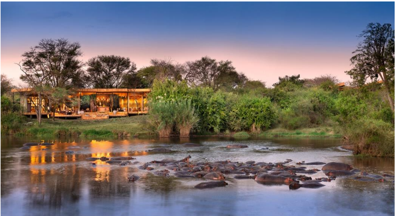
馬賽馬拉自然保護區