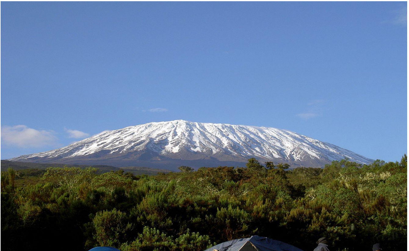
吉力馬札羅山 Mount Gilimanjaro