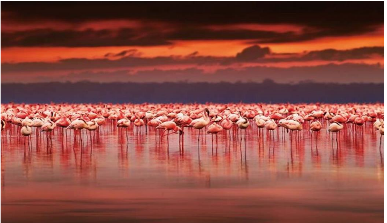
納庫魯湖 lake Nakuru)