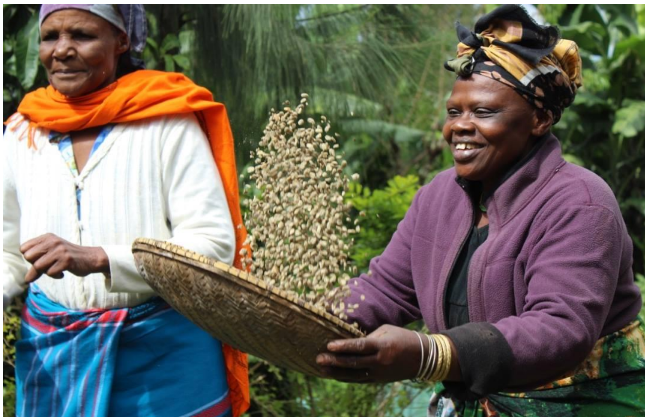
Mulala Cultural Tour