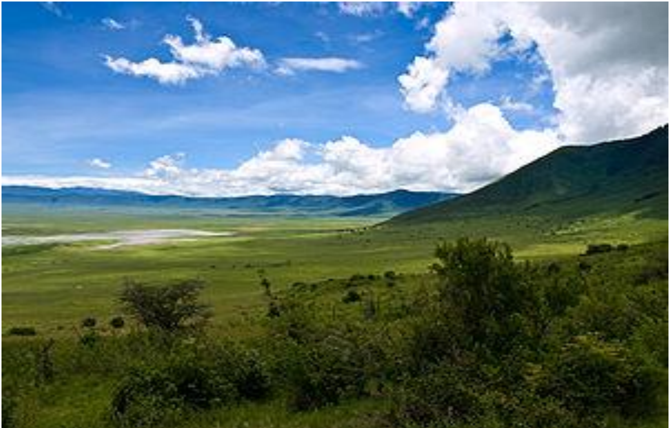
恩戈羅恩戈羅火山一隅

住宿 | Ngorongoro Lodge, Member of Melia Collection 或同級