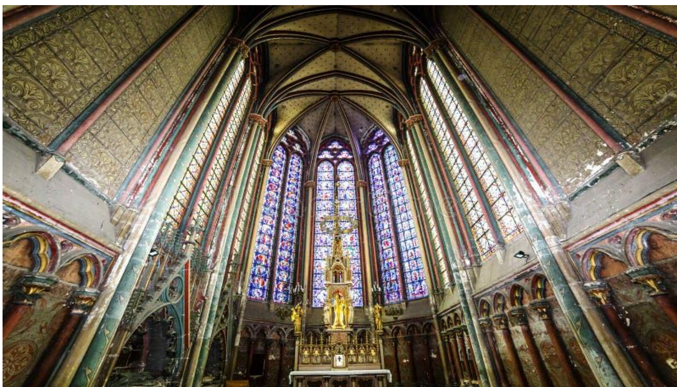
亞眠聖母大教堂 Cathédrale Notre-Dame d'Amiens