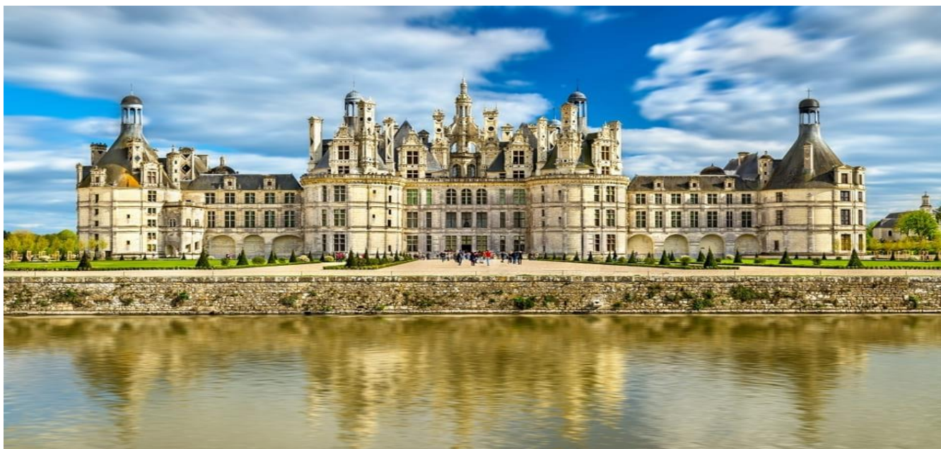
香波堡 Château de Chenonceau