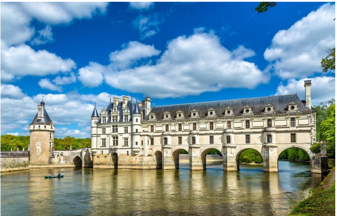
奇儂梭堡橋 Château de Chenonceau

住宿 | 5★Fleur de Loire · Spa Hotel & Restaurant 或同級