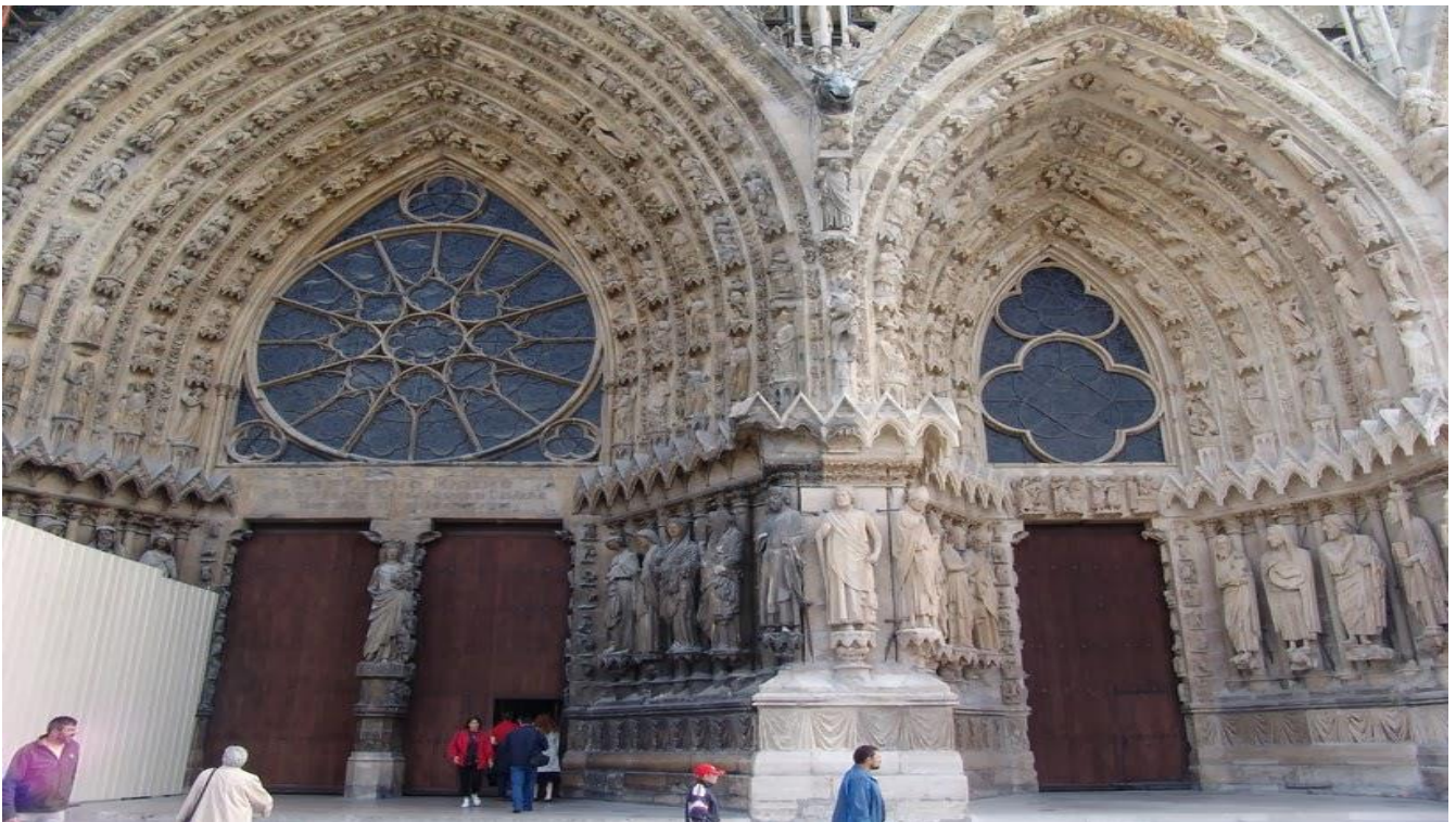
蘭斯主座大教堂 Our Lady of Reims