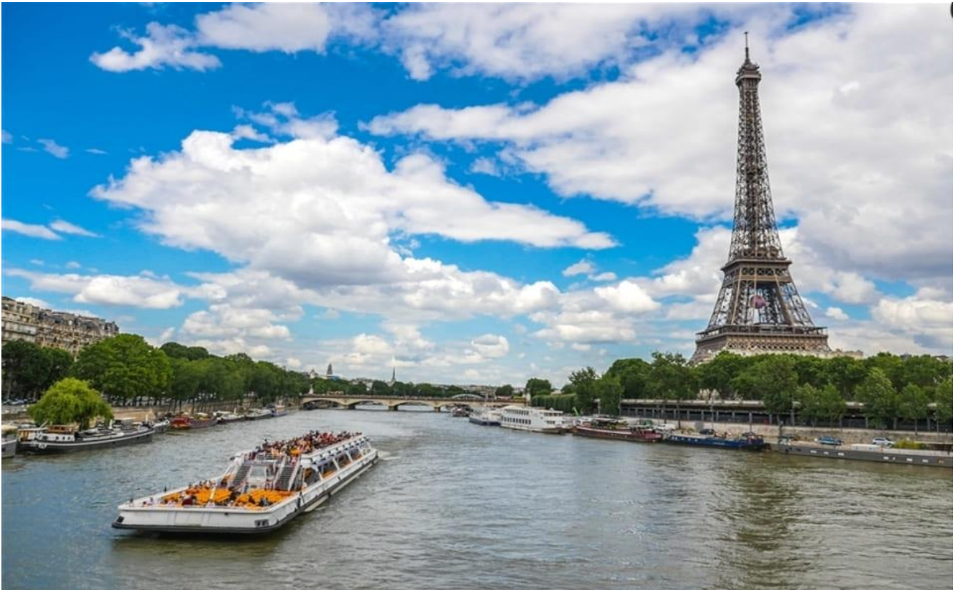
巴黎鐵塔及塞納河