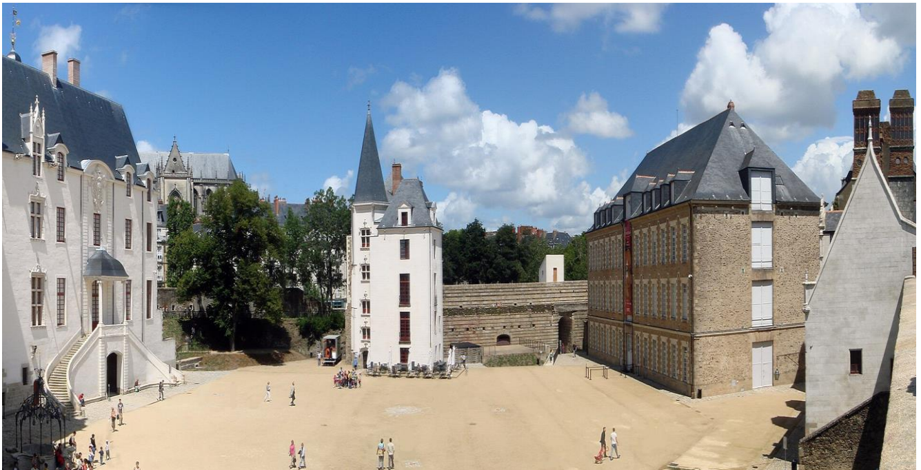
布列塔尼公爵城堡庭院 Château des ducs de Bretagne

住宿 | 5★Hôtel Barrière Le Royal La Baule 或同級